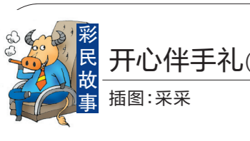
开心伴手礼(上) 插图:采采