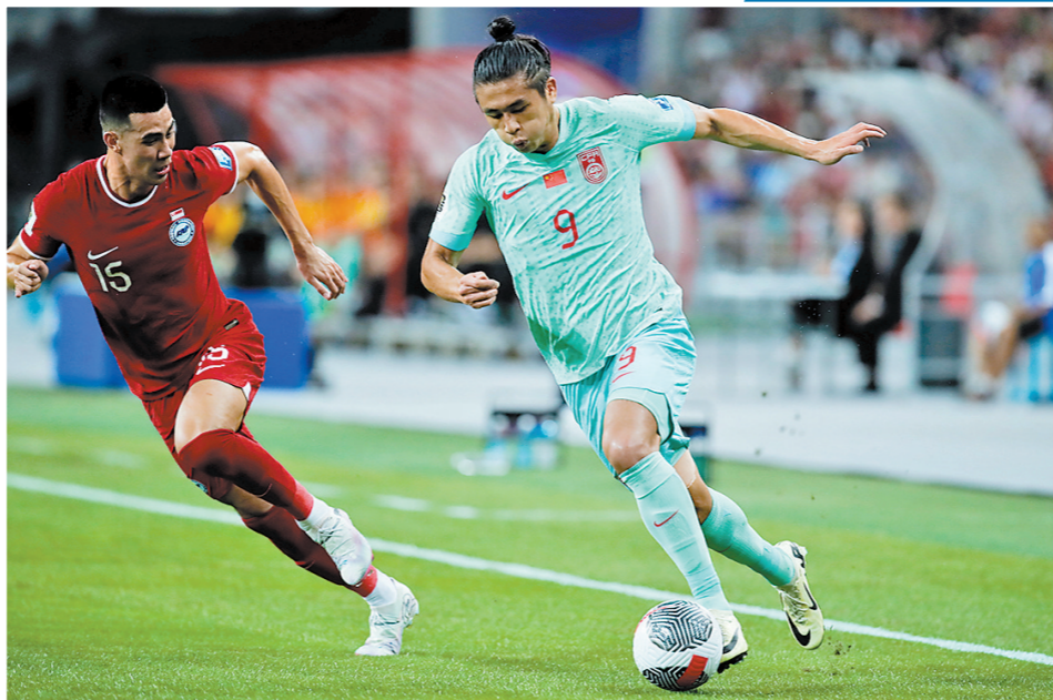
张玉宁带球