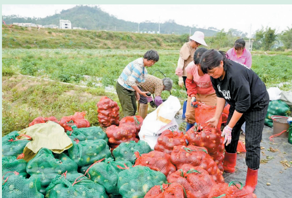
贝贝南瓜即将销往各地