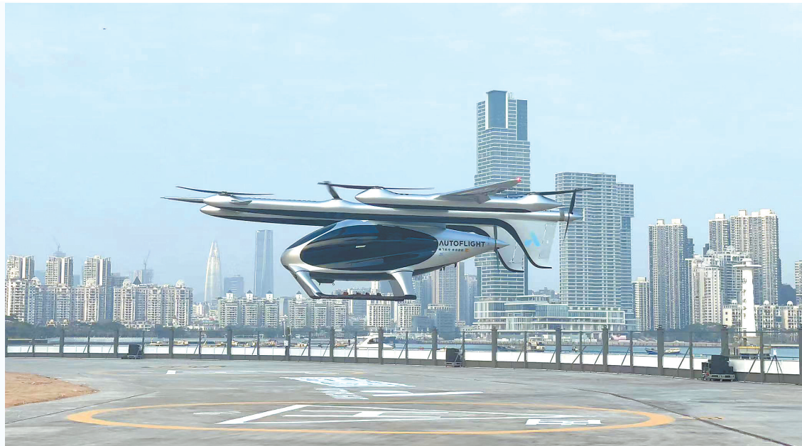
电动垂直起降航空器eVTOL

27日,记者从深圳市交通运输局获悉,中国民用航空局于近日明确支持深圳市建设国家低空经济产业综合示范区、支持深圳完善产业发展服务体系,同意开展低空物流、城市空中交通等研究试点,丰富拓展低空应用场景,构建低空体系,加强数字化网络平台和低空服务基础设施建设。中国民用航空局的支持意见为深圳低空经济产业高质量发展提供了强力支撑。