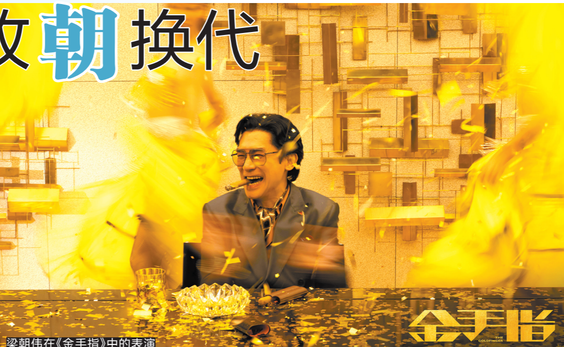
梁朝伟在《金手指》中的表演

4月14日，第42届香港电影金像奖颁奖典礼在香港文化中心圆满落幕。凭借《金手指》，梁朝伟第六次获得金像奖最佳男主角奖；该片还横扫技术类奖项，收获最佳摄影、最佳美术指导、最佳音响效果等技术类奖项，以12提6中的成绩成为数量上的大赢家。 《白日之下》则将多个演员类奖项收入囊中。在片中饰演调查记者凌晓琪的余香凝凭借该片首度获得最佳女主角奖；饰演孤寡老人通伯的姜大卫获得最佳男配角奖，时隔五十余年再度捧起电影奖杯；饰演智力障碍女孩小铃的新生代女演员梁雍婷获得最佳女配角奖。 《毒舌律师》10提1中，获得压轴大奖“最佳电影”奖；另一部去年颇受关注的电影《年少日记》，则为导演卓亦谦赢得“新晋导演”奖。最佳导演奖则由《命案》导演郑保瑞获得。中国台湾的话题电影《周处除三害》获得最佳亚洲华语电影奖。 有趣的是，公认的演技派梁朝伟再次拿到最佳男主角奖，网友却替首次提名的林保怡、黄子华等人可惜。事实上，纵观今年的所有奖项，许多提名者都是首次入围，“港片面孔”已然开始更新换代。而《白日之下》《毒舌律师》等多部新导演之作的作品质量和市场表现都令人惊喜。从网友对此次赛果的反应来看，在港片“后浪”开始成形的当下，人们对金像奖和香港电影都有了新的期待：打破保守，不再论资排辈，让更多新面孔出现在领奖台上。