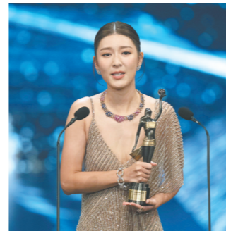
余香凝获得最佳女主角奖

今再给他一个金像奖，还有意义吗？颁奖礼上，梁朝伟因为在德国拍戏而以视频连线方式出现，太太刘嘉玲则在现场代为领奖。梁朝伟的得奖感言得体但简单，反而刘嘉玲已经预料到他拿奖的争议并主动提及。她连夸两次梁朝伟“伟大”：“梁朝伟一拿奖，很多人都说‘不是吧，又是他，给点机会给别人吧’。但我这么多年在他身边，我觉得他真的是个伟大的演员。普通演员可能付出100分、200分努力，但梁朝伟先生付出了500分、1000分的努力。我觉得香港