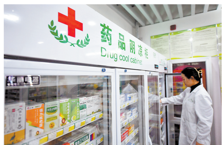
药店工作人员在为顾客取药

今年3月，有投资者在互动平台提问马应龙：“西安杨森的太宁复方角菜酸酯栓、乳剂2023年底开始停产，请问马应龙有没有计划生产复方角菜酸酯栓、乳剂，以占领原使用西安杨森的太宁复方角菜酸酯栓、乳剂的痔疮市场？”