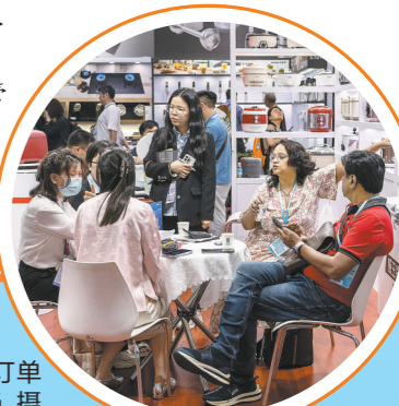
广交会上，供采对接达成外贸订单