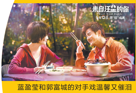
蓝盈莹和郭富城的对手戏温馨又催泪