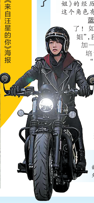
《来自汪星的你》海报