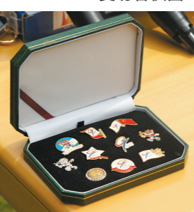
九运会全套会徽