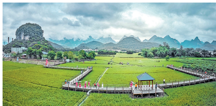
清远清新,旅游市场多点开花