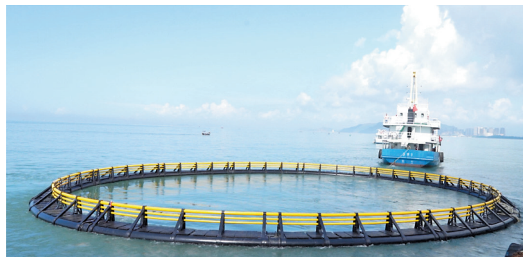
汕尾,拉着网箱的轮船驶向江牡岛现代化海洋牧场 资料图

5月9日,省委农村工作会议暨深入实施“百县千镇万村高质量发展工程”推进会在广州召开。交流发言环节,在2023年度考核评价获批优秀的地市、县(市、区)代表分享了过去一年在推动“百千万工程”落地落实上的创新实践。