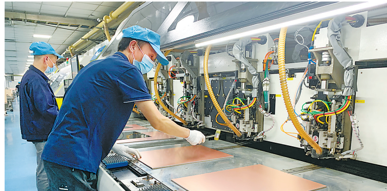
江门鹤山,泰利诺电子有限公司车间内,工人忙碌工作