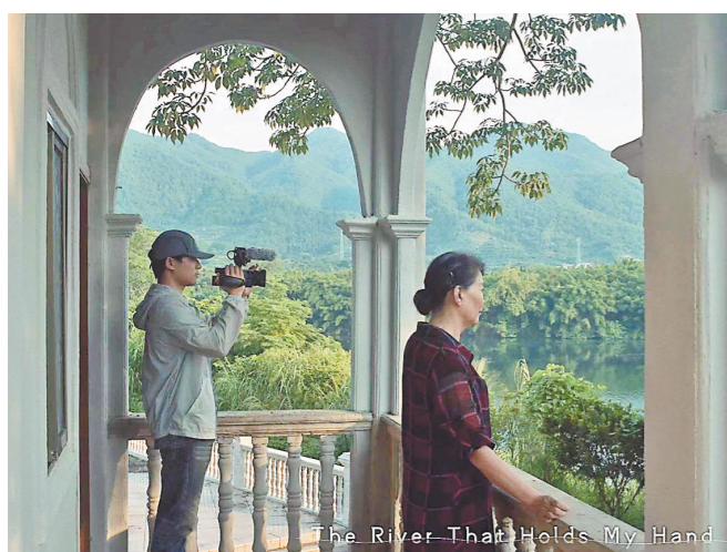
The River That Holds My Hand