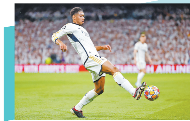
贝林厄姆在比赛中

现在的多特蒙德主帅阿尔奇奇，带领球队打出近乎完美的防守足球。在半决赛以两个1比0气走群星荟萃的巴黎圣日耳曼。胡梅尔斯领衔的“大黄蜂”防线众志成城，大巴黎在半决赛两回合射门次数多达44次，成为有这项统计以来在欧冠半决赛射门次数最多却无法进球的球队。