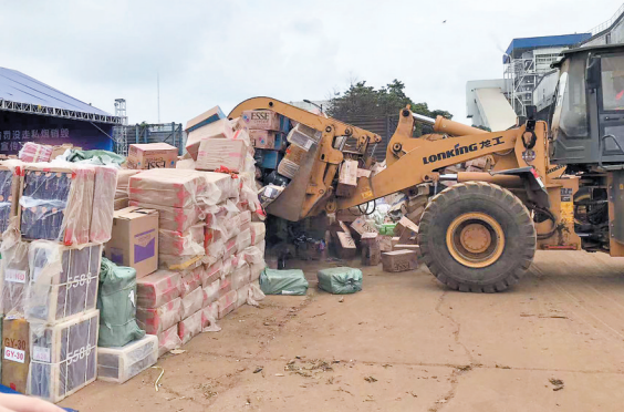
一件件罚没走私卷烟被粉碎后送进焚烧炉

湛江地处广东打击烟草走私的“桥头堡”。湛江海关依托大数据、云计算等信息技术手段，联合烟草、海警、公安等部门，聚焦海上偷运上岸、陆路过境运输等走私环节，稳步提升跟踪打击能力。2019年以来，该关共破获走私卷烟刑事案件78起，案值40.8亿元，涉税22.9亿元。