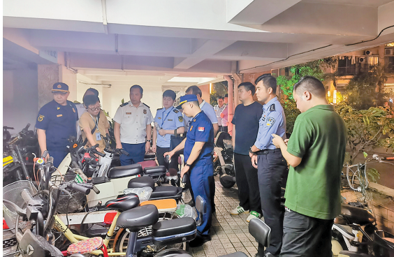
广州多部门开展电动自行车集中夜查

此次夜查行动中中共检查住宅小区2772个，自建房12534个，三合一、沿街门店、夜间经营场所29007家，累计现场清理违规停放充电自行车13520辆，发现改装电动车427辆，拟处罚物业服务企业和社会单位场所共535家，拟处罚金额共计52.93万元；处罚个人2132人，拟处罚金额共计9.41万元。