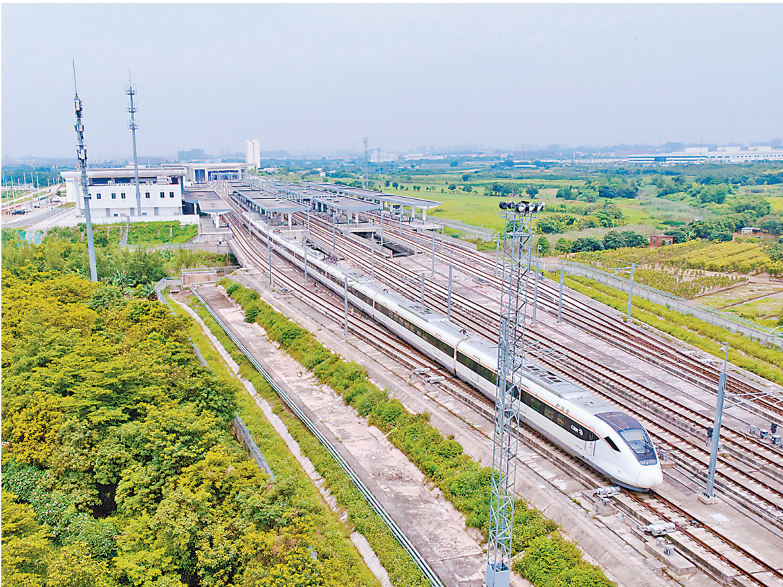
一条全长258公里的交通大动脉即将形成

点，“搭城际游湾区”专题摄影展也将设在番禺站展出，而在“四线”贯通运营首发列车上，列车长会不定时间旅客派送鲜花。