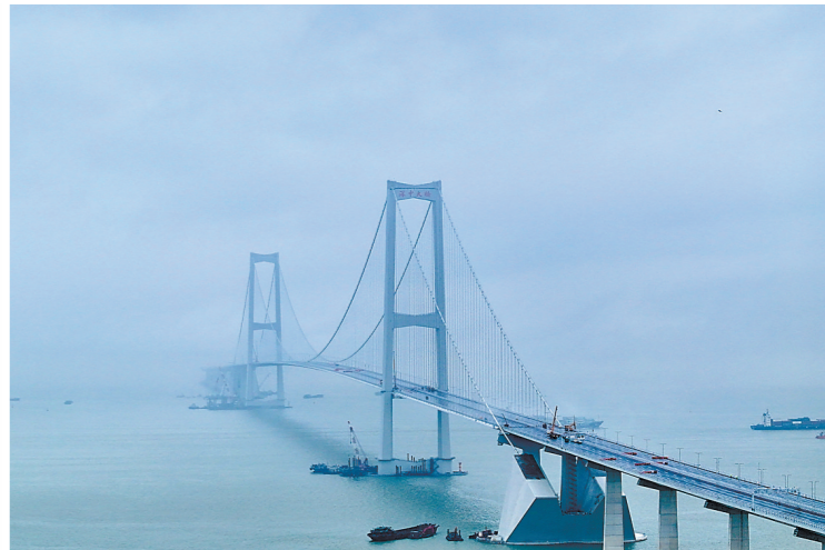
深中通道深中大桥航拍图

深中通道是集桥、岛、隧、水下互通于一体的世界级跨海集群工程，北距虎门大桥约30公里，南距港珠澳大桥约31公里，是环珠江口100公里“黄金内湾”A字形交通网络骨架的关键一横。路线全长约24公里，起自深圳机场互通，与广深沿江高速（一、二期）相接，向西跨越珠江口，在中山马鞍岛登陆，与中开高速对接，通过连接线实现在深圳、中山及广州南沙登陆，采用双向八车道、设计速度100公里/小时的高速公路技术标准。