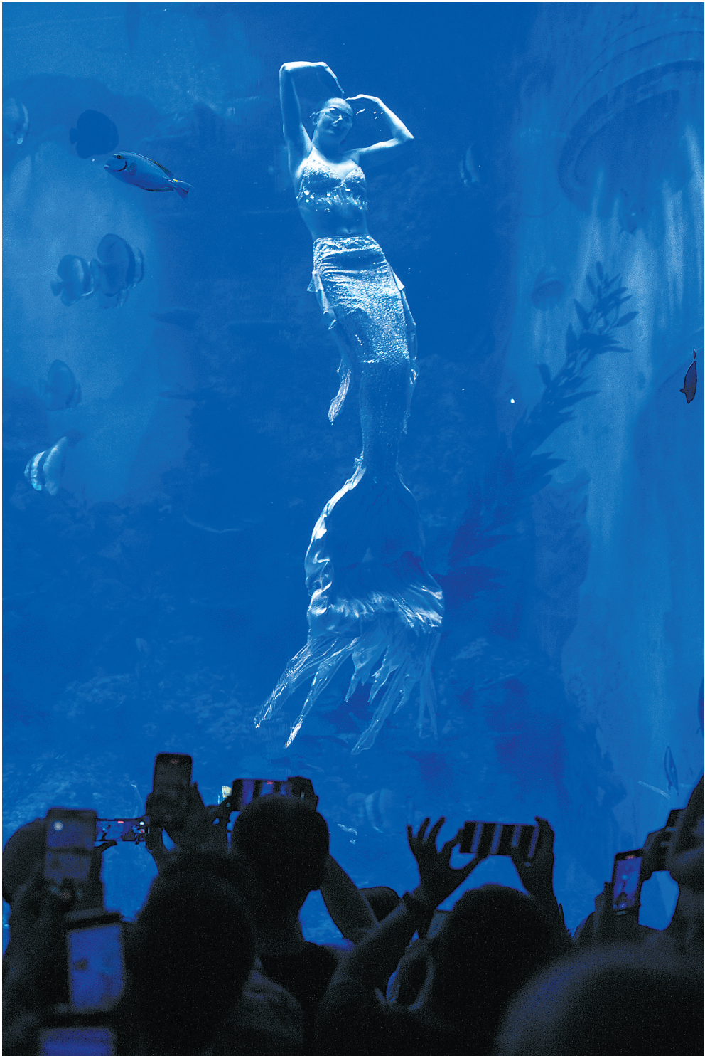
人鱼童话演出中,游客纷纷拍照打卡