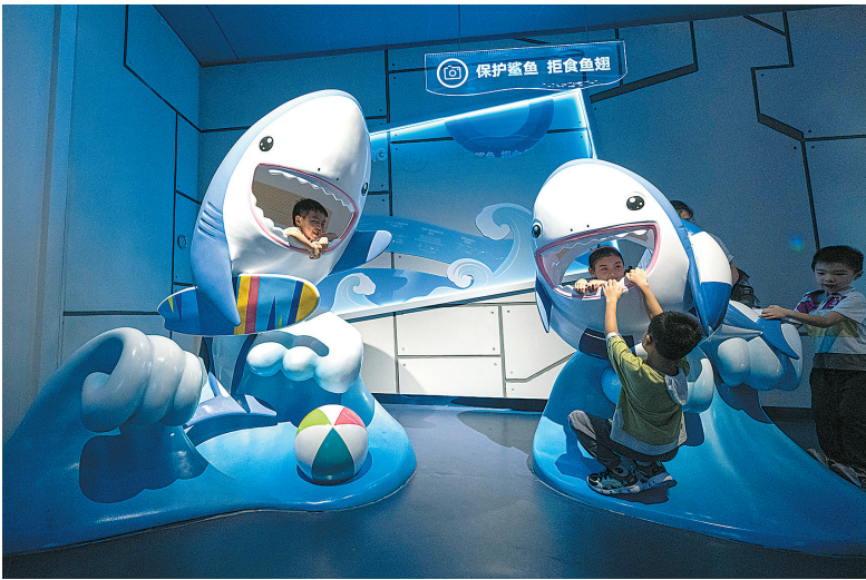
儿童在海洋馆未来海鲨鱼实验室内玩耍