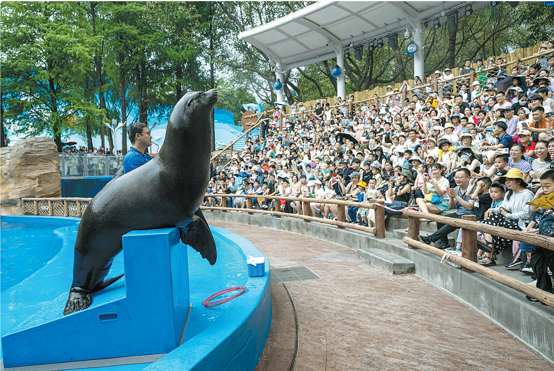
海狮与游客互动表演