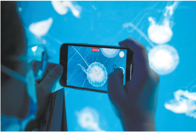
水母的轻盈身姿在水中飘逸舞动,宛如一位优雅的舞者