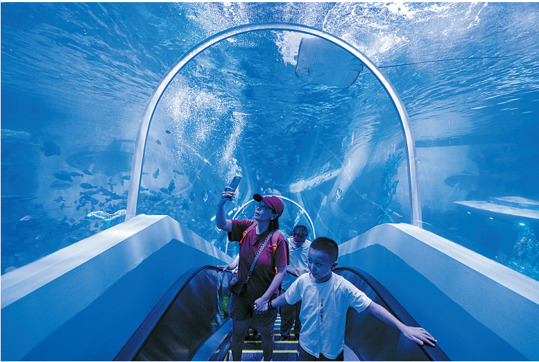
游客乘坐扶手电梯穿梭在海底隧道中