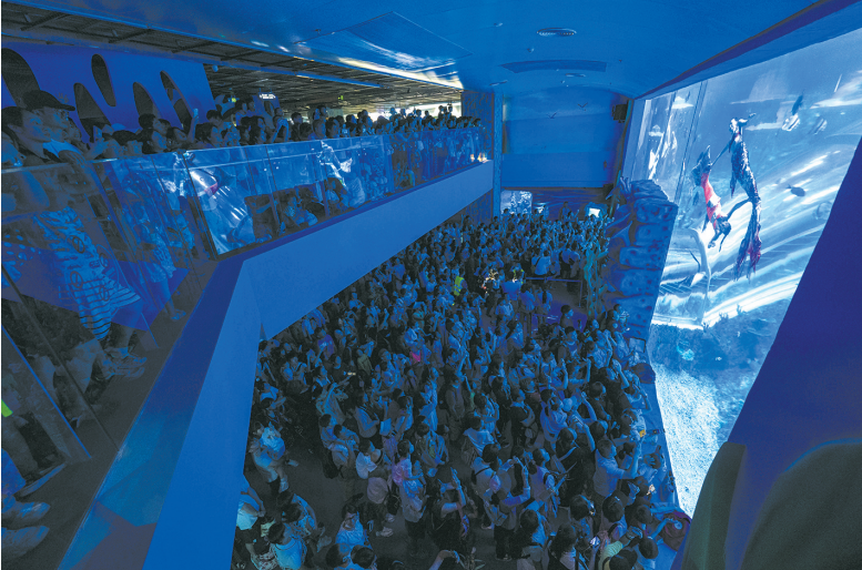
人鱼童话演出吸引了大批游客观看