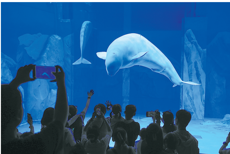
活泼可爱、热情好客的白鲸与游客“打招呼”