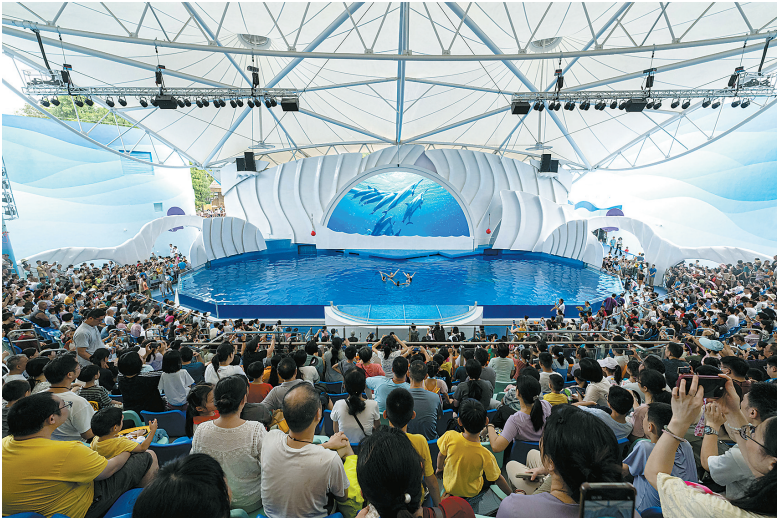
游客观看海豚奇缘自然展示