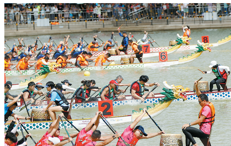
龙舟队伍竞渡，上演“速度与激情”

羊城晚报讯 记者石梦卓、实习生汪雅丽报道：6月22日至23日，“粤港澳大湾区（东莞）龙舟邀请赛暨龙舟嘉年华在东莞市麻涌镇华阳湖国家湿地公园举办，来自大湾区以及世界各地的59支龙舟强队在此集结，竞逐“大湾区龙王”宝座，共同上演全国最长龙舟月——“东莞龙舟月”年度收官大戏。