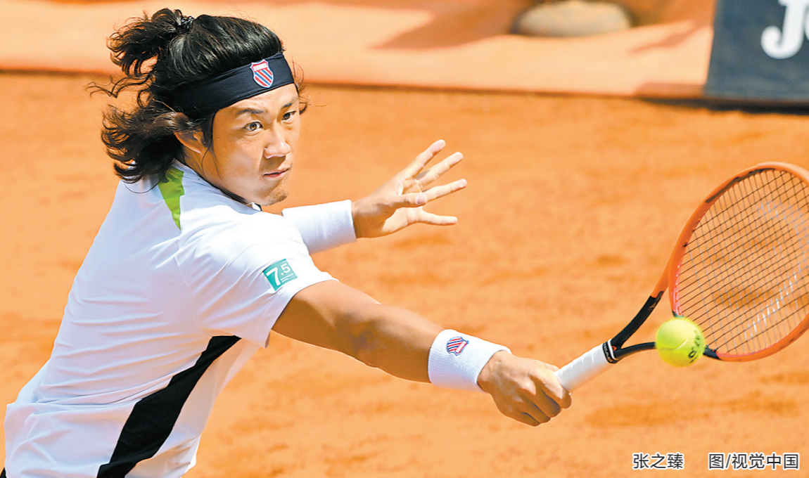
张之臻 图/视觉中国