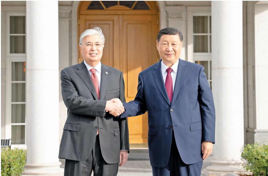
习近平同托卡耶夫握手