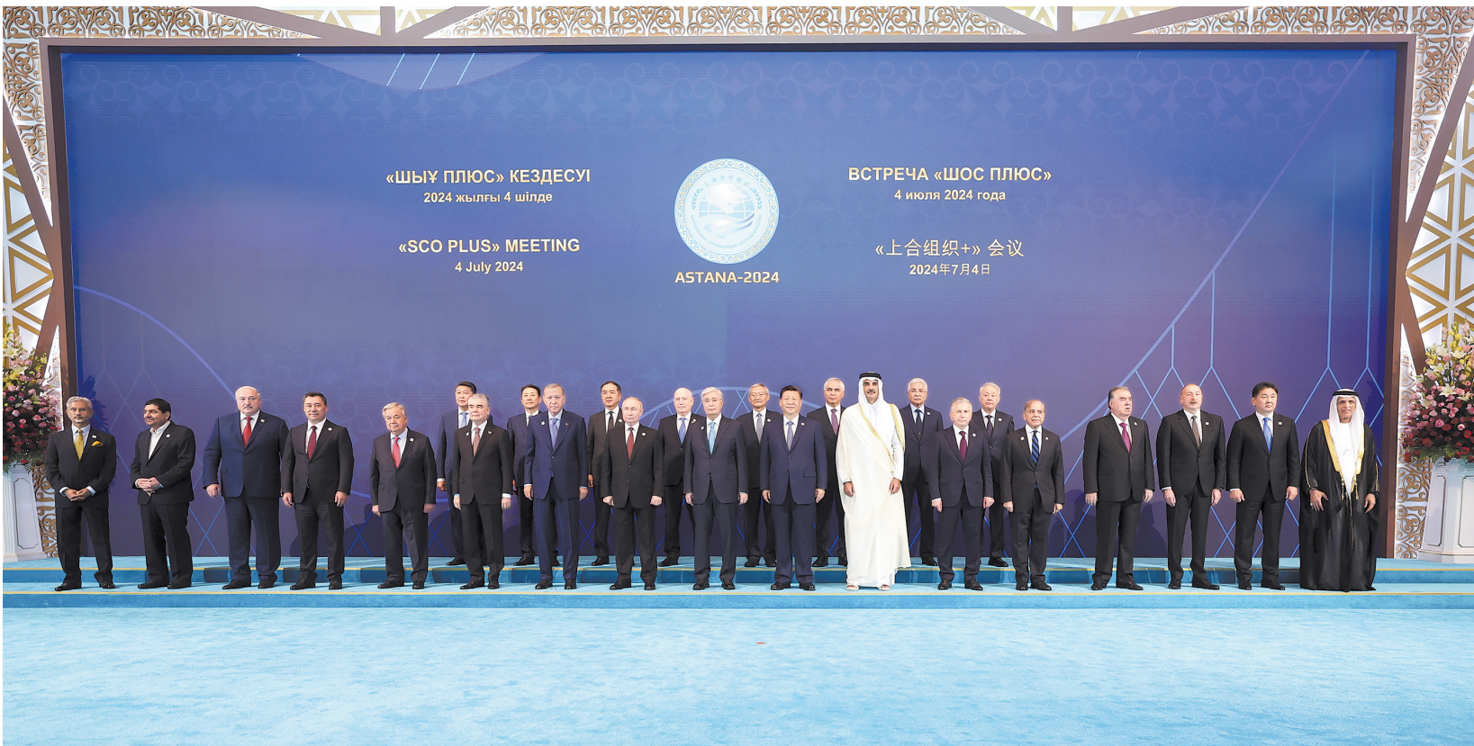
当地时间7月4日下午，国家主席习近平在阿斯塔纳出席“上海合作组织+”阿斯塔纳峰会并发表题为《携手构建更加美好的上海合作组织家园》的重要讲话。峰会开始前，习近平出席托卡耶夫为与会代表团团长举行的欢迎宴会并集体合影

运行效能。 第四，建设睦邻友好的共同家园。充分发挥上海合作组织睦邻友好合作委员会等民间机构作用，继续办好传统医学论坛、民间友好论坛、青年交流营、青年发展论坛等品牌活动。欢迎各方积极参加青岛绿色发展论坛、妇女论坛。未来5年，中方将向本组织国家提供1000个青年赴华交流名额。 （下转 A2）