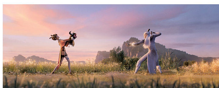
金风与小凡初相逢