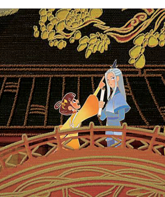
影片呈现了多种动画技法