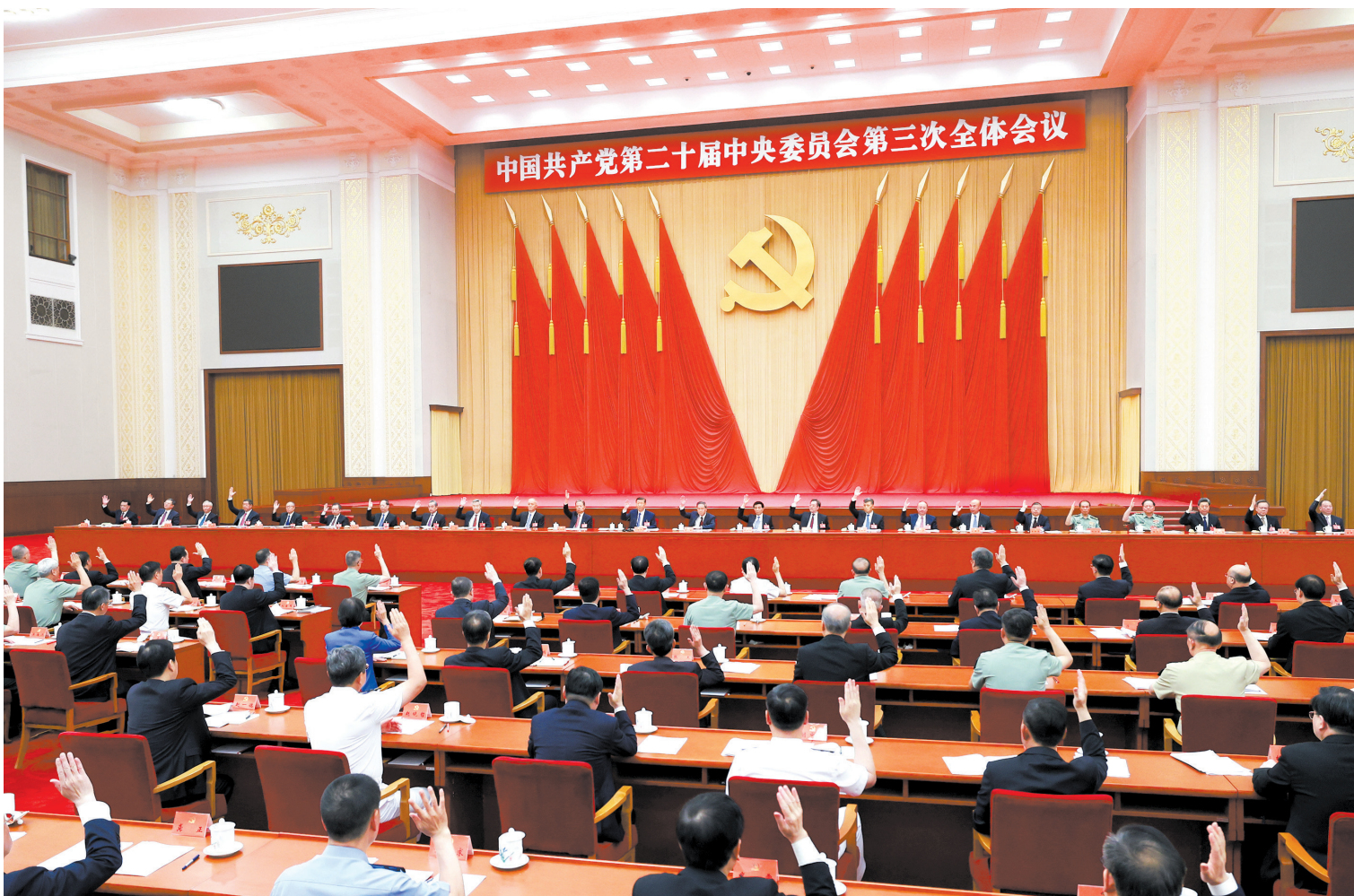
中国共产党第二十届中央委员会第三次全体会议，于2024年7月15日至18日在北京举行。 中央政治局主持会议