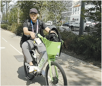
记者在巴黎骑共享单车