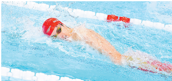
潘展乐在比赛中