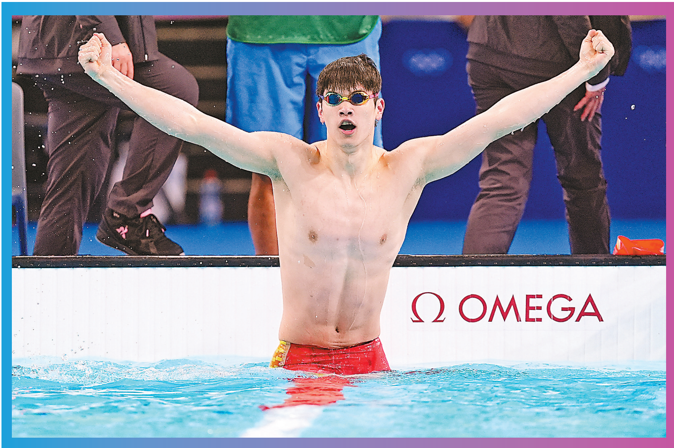
潘展乐在比赛后庆祝

在北京时间8月1日凌晨进行的巴黎奥运会男子100米自由泳决赛中，中国运动员潘展乐以46.40秒的成绩夺冠并打破自己保持的46.80秒的原世界纪录。澳大利亚运动员查尔莫斯以47.48秒获得亚军，罗马尼亚运动员波波维奇以47.49秒获得第三名。在奥运会的决赛中领先第二名一秒以上，在这个不利于出好成绩的泳池中超大幅度打破世界纪录，潘展乐这块金牌的含金量已无须多言。