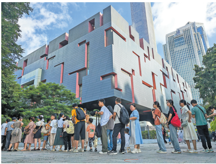
3日8时30分，前来体验省博“半小时免预约”的市民、游客大排长龙