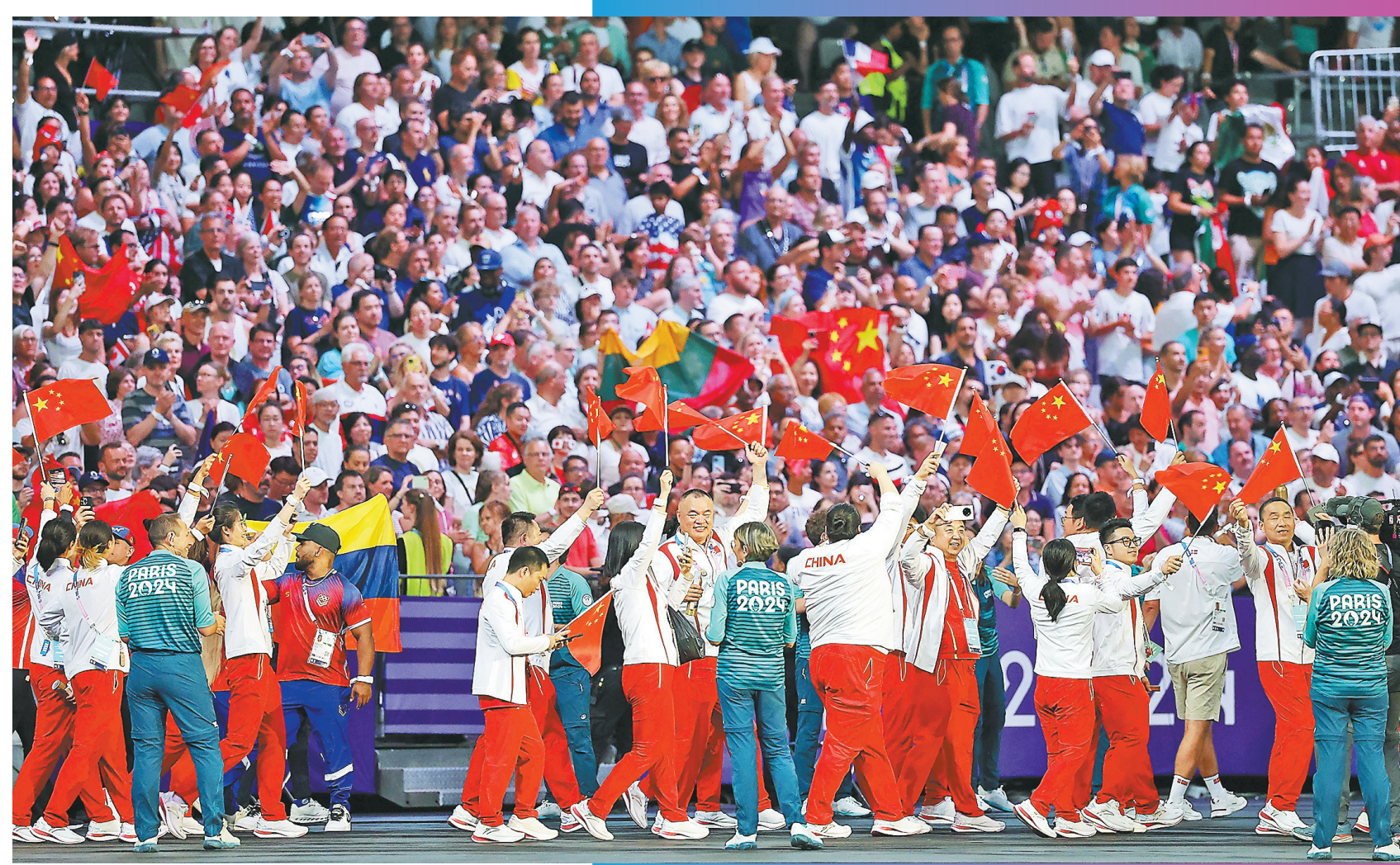
11日，中国体育代表团在闭幕式上入场