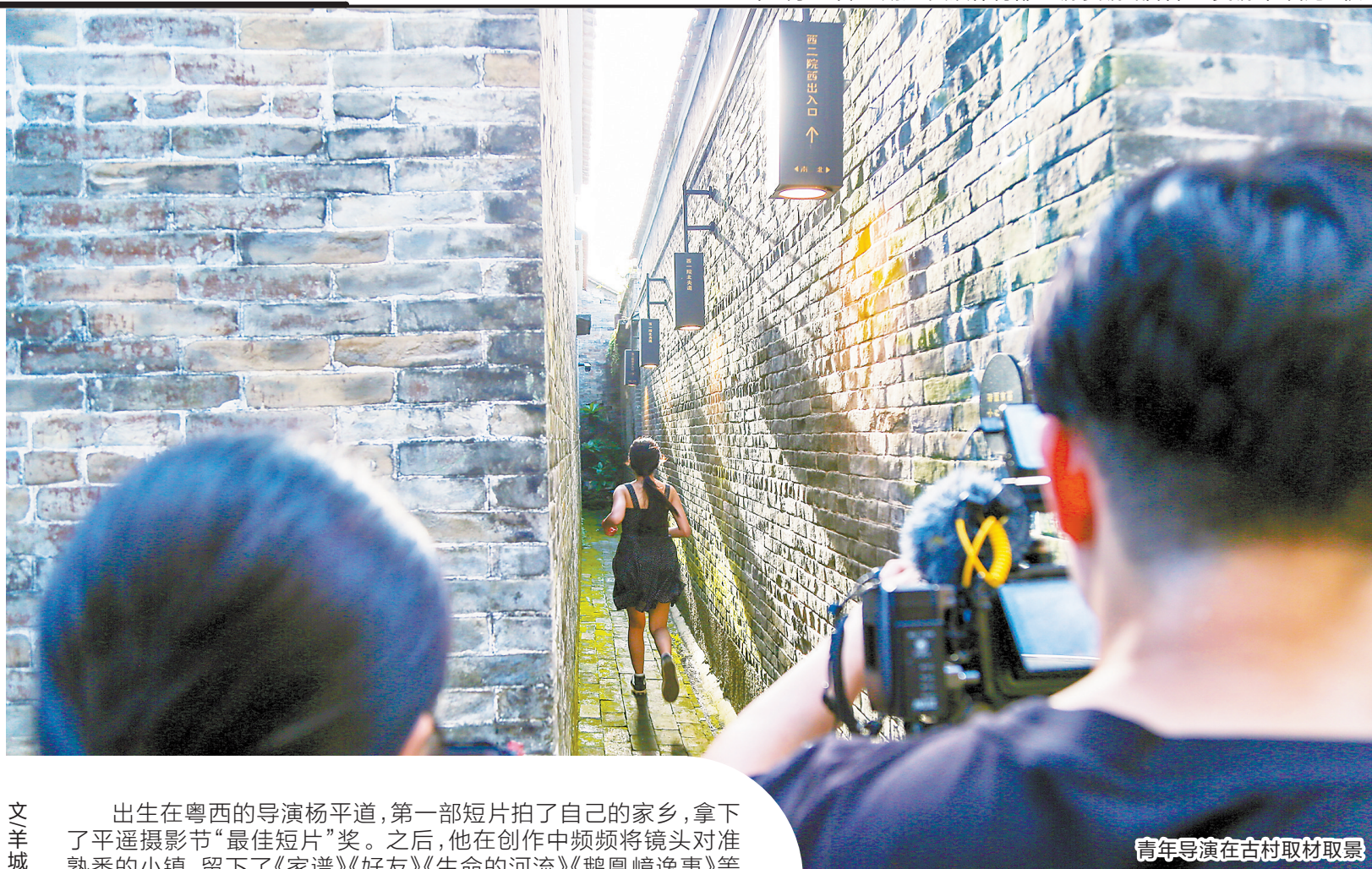
青年导演在古村取材取景

“向山海走去”青年导演创作扶持计划是由羊城晚报报业集团主办的对海内外优秀华人青年导演进行挖掘、孵化、选拔和培养的大型人才扶持活动。活动立足粤港澳大湾区，面向全球寻找影像创作领域的新锐力量，支持他们探索剧情、纪录、动画等不同类型的短片创作，突破和展开对未来华语影像文化的想象之路，也让世界通过影像重新发现中国。