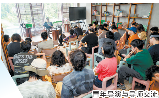
青年导演与导师交流