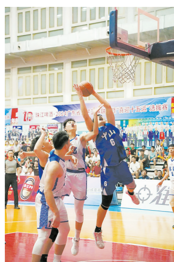
半决赛现场