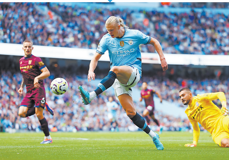
哈兰德(中)上演帽子戏法