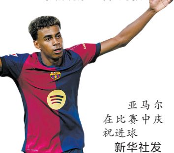
亚马尔在比赛中庆祝进球