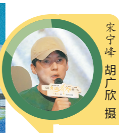
▲宋宁峰张歆艺演夫妻