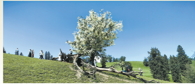
旷野里的一棵大树