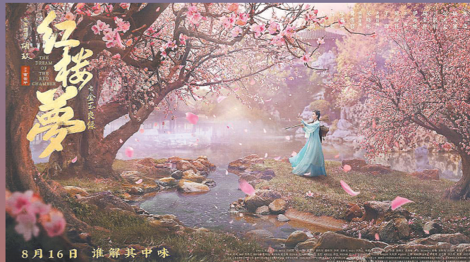
《红楼梦之金玉良缘》惨遭翻车