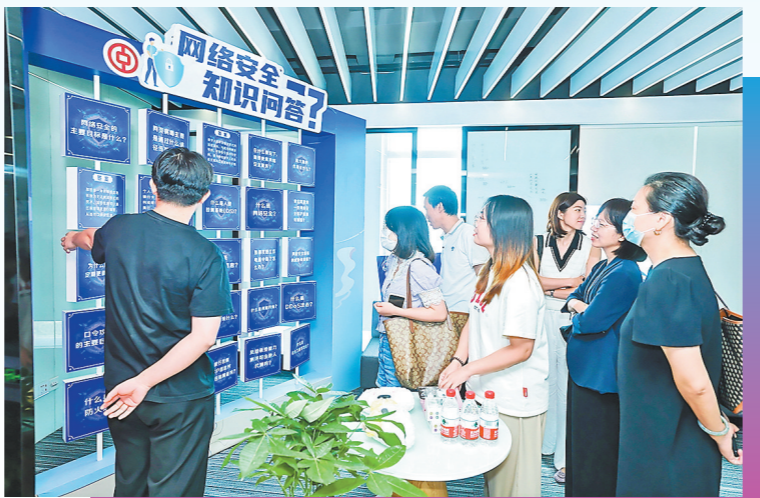
网络安全知识问答