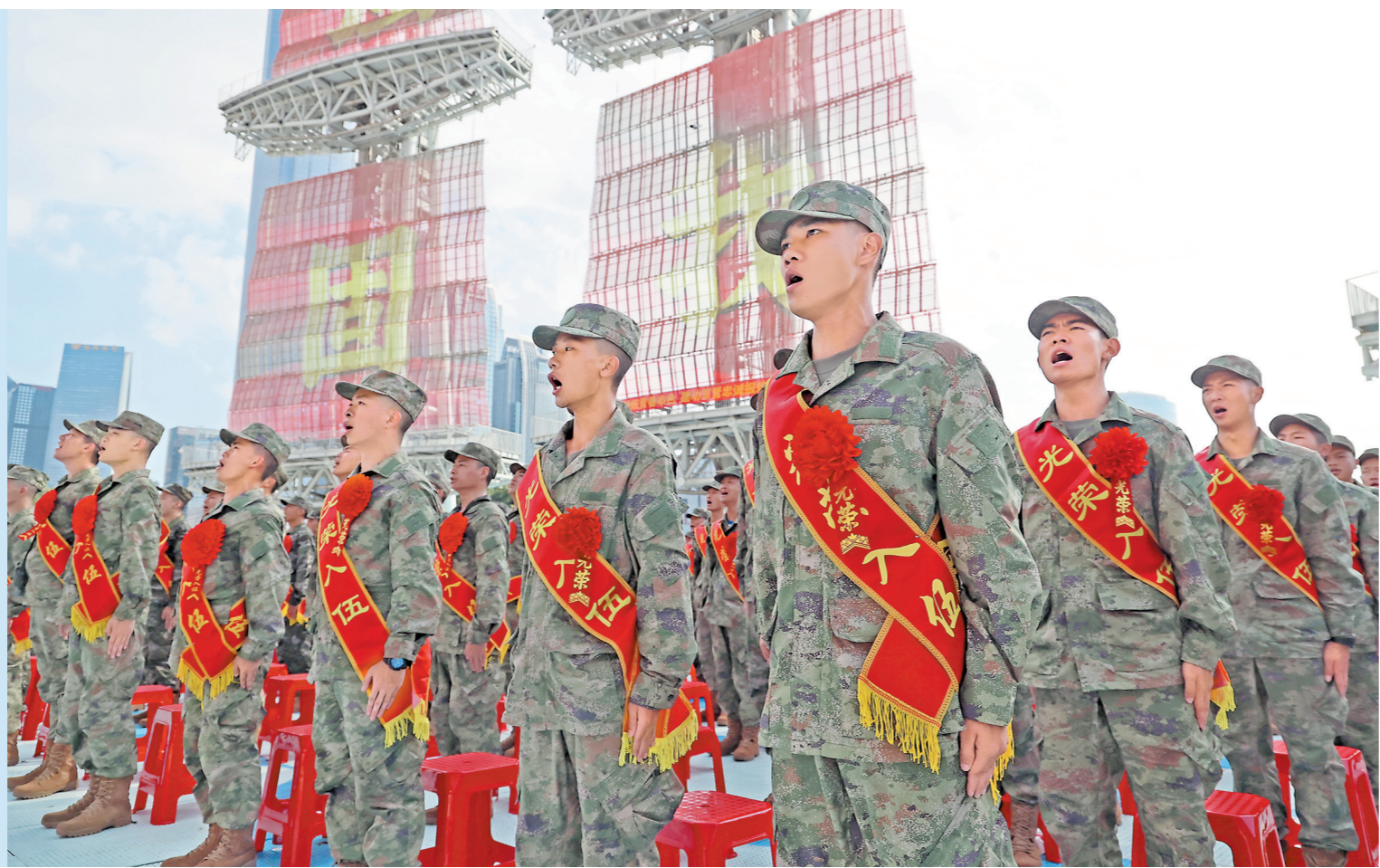
广州市2024年秋季新兵入伍欢送仪式在海心沙亚运公园举行