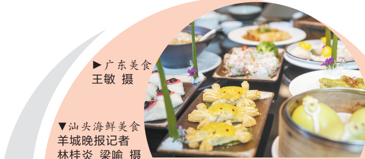
广东美食

广州地区旅行社行业协会秘书长李明德介绍，在广东旅游对外发展过程中，很早就从旅游产品设计上突出美食吸引游客，“民以食为天”，“食在广州（广东）”是广东