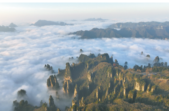
张家界深受日韩游客欢迎

第10届中日韩旅游部长会议11日在日本神户召开。在会上，三方一致同意加强合作，实现到2030年三国之间游客互访增加到4000万人次等目标。数据显示，今年7月，中国游客在日韩两国外国游客中的占比均为最高。