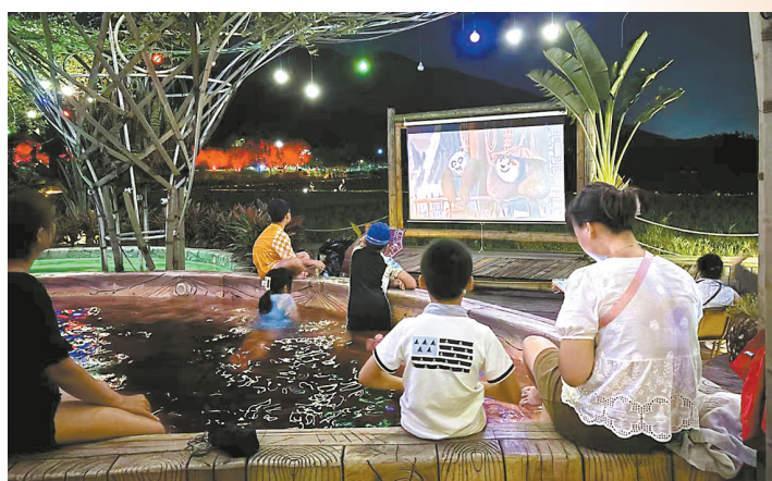
民俗泡温泉赏月看电影 广州从化福禧温泉

今年中秋小长假，“在路上”的游客对中秋佳节的“奔赴”做出另一种诠释：除了回乡团聚，赏灯看烟火、泛舟赏月、汉服游园等中式旅游方式极度升温，体现出当代人对节日传统习俗的深度奔赴。携程发布的2024年中秋假期旅游总结显示，中秋佳期间，富含传统文化元素的活动成为游客的热门选择，人们尽情沉浸感受中国传统节日的魅力。