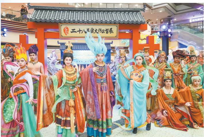
十八星宿大湾区首展 正佳广场举办山西晋城玉皇庙二

基于对文化体验的深度追求，赏月也成为假期人们选择酒店的重要考量因素。不仅“赏月航班”成为热门，在同程旅行平台，适宜