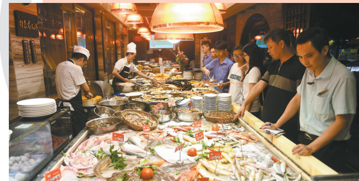
汕头海鲜美食 羊城晚报记者 林桂炎 梁喻 摄

旅游的金名片之一，对世界各地游客有着巨大的吸引力。李军也认为，以美食为主题的旅游产品在广东也非常丰富，美食旅游市场提供了早茶体验、烹饪课程、美食节庆、海鲜美食游和特色街区探访等，满足了游客对美食文化的探索需求。“我的行程我做主，我的美食我做主。”随着人们对个性化和深度体验的追求增加，市场对创新型