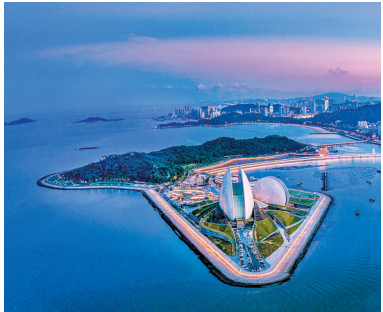
珠海大剧院