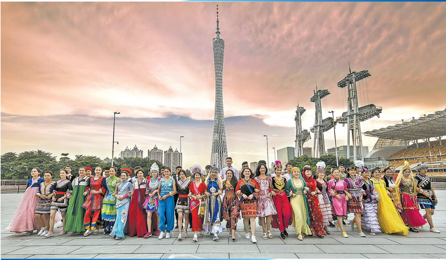
广东文旅不断出新出彩