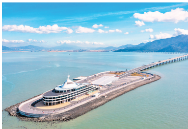
港珠澳大桥蓝海豚岛