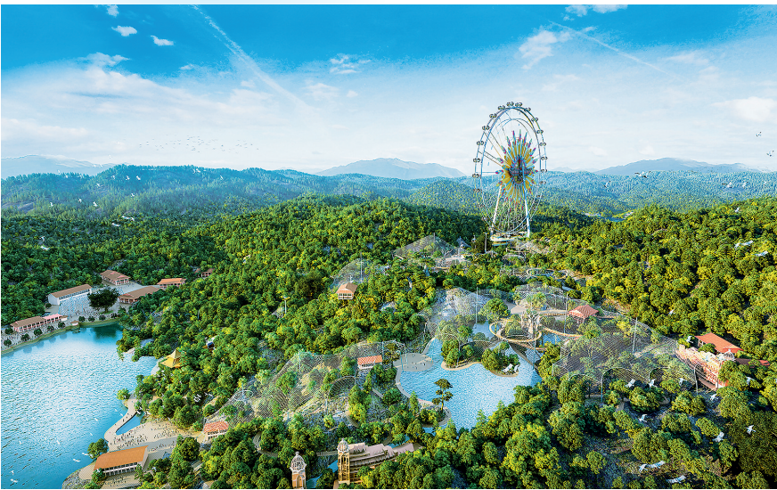
清远长隆首期项目效果图

9月25日上午，全省旅游发展大会在广州召开，全面落实全国旅游发展大会要求，研究部署广东旅游工作。在大会交流发言环节，多家本地文旅企业代表上台发言，畅谈广东文旅发展大计，全面筹谋崭新未来。