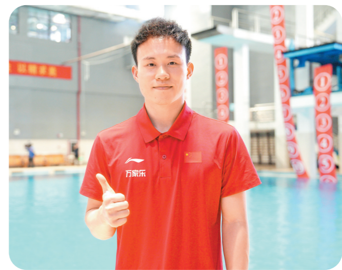
谢思埸 羊城晚报记者 钟振彬 摄