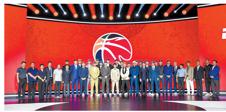
2024年中国男子篮球职业联赛(CBA)选秀大会