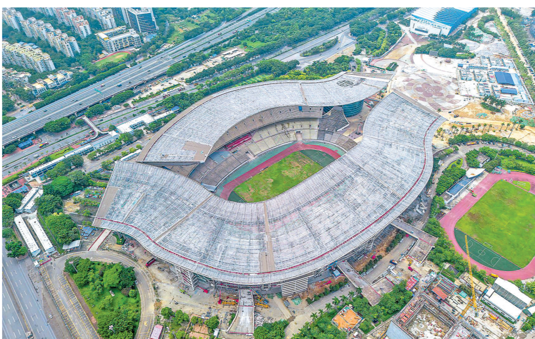
广东奥林匹克体育中心