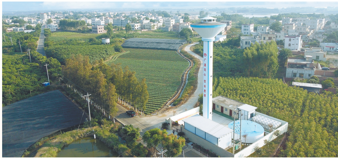
广州水投自来水公司帮扶湛江开展集中供水提质提标改造

无论是城镇还是乡村,居民均渴望用上安全卫生的生活用水。广州水投自来水公司(以下简称“广州自来水公司”)积极参与“百千万工程”相关工作,持续关注城镇和乡村在供水服务上所存在的差异,出人出资出技术消除差异。2025年将是广东省“百千万工程”的“三周年初见成效”之年。在距离2025年元旦尚余近三个月之际,不少曾被广州自来水公司帮扶过的乡村,已用上和城镇区域同源同质安全卫生的生活用水。部分帮扶成果,还顺着东西部协作、对口帮扶等途径延伸到广东以外。