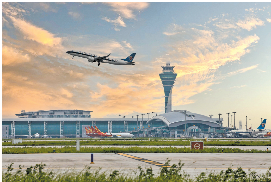
作为全方位门户复合型国际航空枢纽之一,近年来广州白云机场国际航空枢纽建设成果显著

其次,政府部门为广州举办航空盛会提供了厚实的“土壤”。从国家层面的宏观规划来看,广州在我国各大城市中的定位一直都是国际航空枢纽的“领头羊”。日