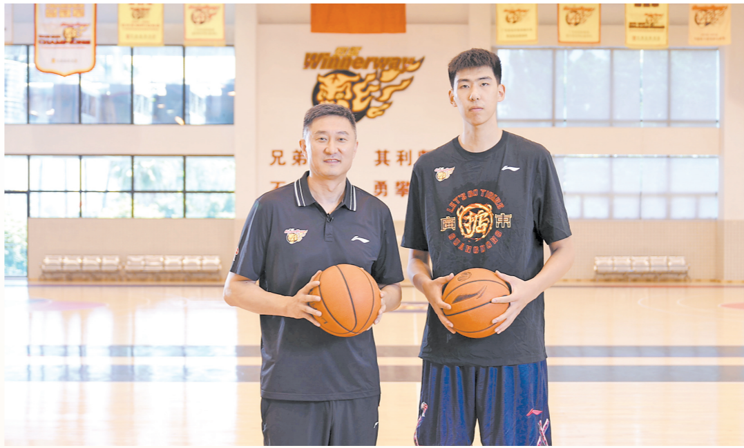
广东宏远篮球队为“百千万·全莞拍”活动代言

目前，“百千万·全莞拍”（原“一键找城管”小程序）已列入东莞市“百千万工程”建设亮点项目，在全国住建系统推广。数据显示，该项目上线一个月后，已有992人参与取得文明头衔，超12000宗城市管理问题被反映，近600件积分礼品被兑换。其中包括VIVO耳机、乐心手环、现金红包、话费流量等奖励，还有超300人分享活动到朋友圈，加速成为文明助攻王，拿到东莞文明随手礼。