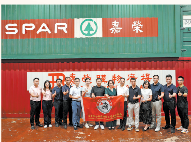
“莞光彩·名企参访”走进嘉荣物流园

深入问情走访，为会员企业提供一对一菜单式服务，常态化开展“体检”和“诊治”，监测和修复会员企业信用报告，纠正年报数据问题、提供商标品牌预警、开展广告宣传风险预防、打造专项金融服务包、就业创业试点工作、数字化经营培训等众多服务，为会员企业解难题办实事，深受会员喜爱。