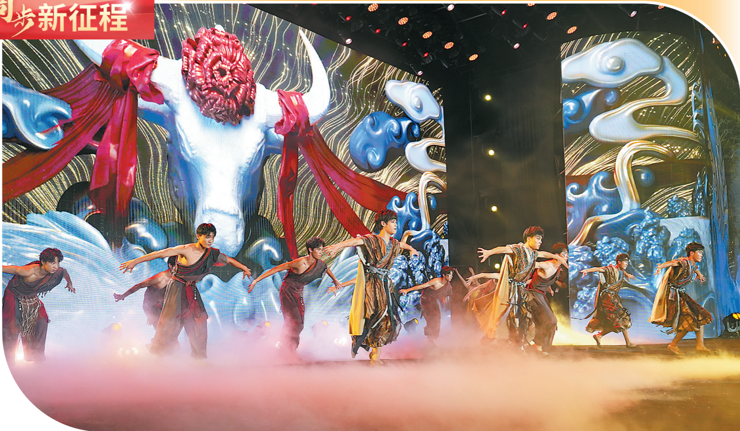
晚会开场舞蹈《云浮山开向海阔》展现了国家非物质文化遗产保护名录中的“禾楼舞”

羊城晚报讯 记者郑俊良报道：9月28日晚，大金山下的云浮市体育公园人如潮涌，欢声不绝。9月28日是云浮建地级市30周年的日子，2024广东云浮之夜文艺晚会在这里上演。