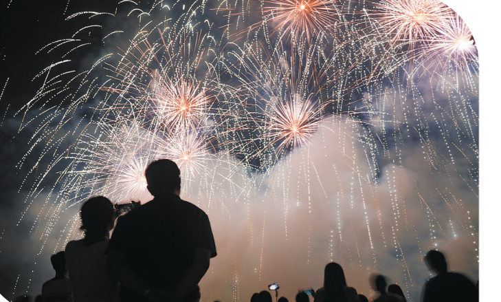
市民们观看烟花汇演