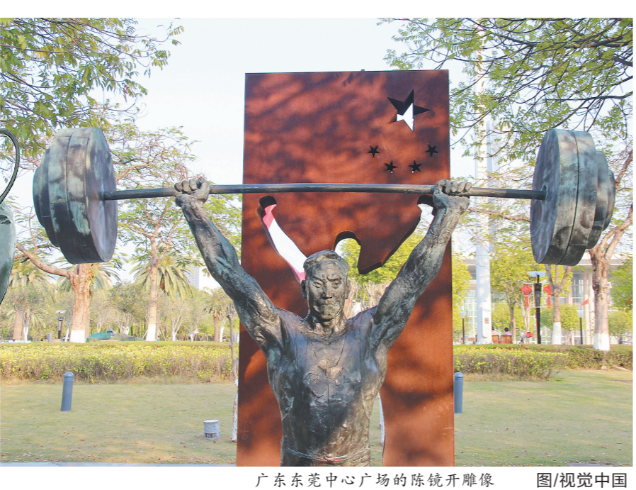
广东东莞中心广场的陈镜开雕像