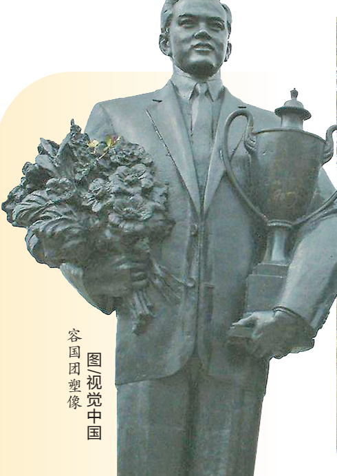
容国团塑像