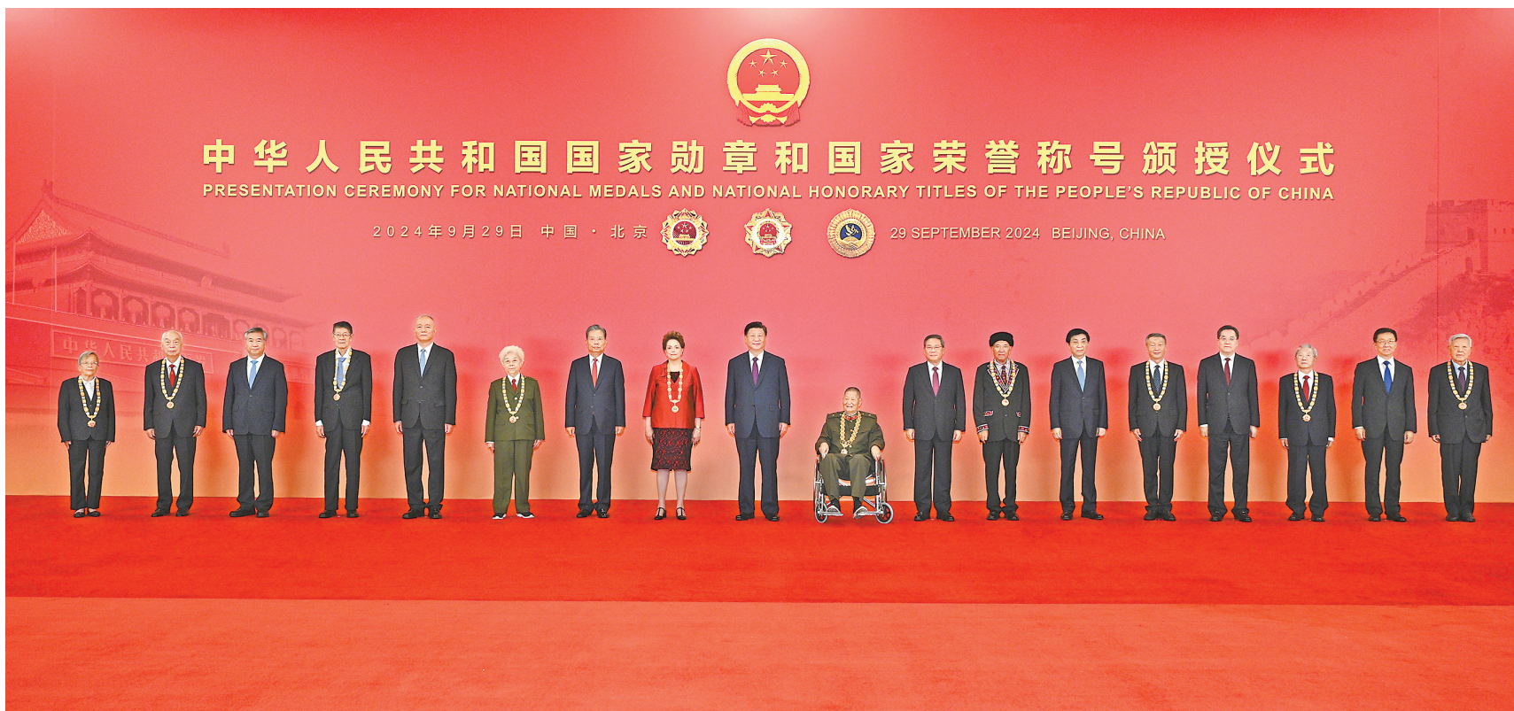
9月29日，中华人民共和国国家勋章和国家荣誉称号颁授仪式在北京人民大会堂金色大厅隆重举行。习近平等领导同志同国家勋章和国家荣誉称号获得者合影留念

新华社电 中华人民共和国国家勋章和国家荣誉称号颁授仪式29日上午在北京人民大会堂金色大厅隆重举行。中共中央总书记、国家主席、中央军委主席习近平向国家勋章和国家荣誉称号获得者颁授勋章奖章并发表重要讲话。习近平强调，伟大时代呼唤英雄、造就英雄。英雄辈出，党和人民事业就会兴旺发达、长盛不衰。各级党委和政府要关心关爱英雄模范，推动全社会尊崇英雄、学习英雄、争做英雄。希望受到表彰的同志珍惜荣誉、再接再厉，争取更大荣光。