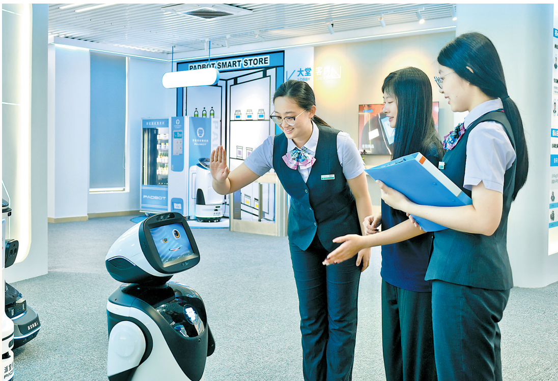
农行广州分行工作人员走访专精特新中小企业

金融是国民经济的血脉。近年来，中国农业银行广东省分行（以下简称“农行广东分行”）主动融入地方经济大局，引导辖内分支行多维度发力，不断提升普惠金融的精准性、便利性、可得性，不断满足人民群众日益增长的金融服务需求，有力保障普惠金融政策发挥应有作用，为广东新质生产力发展注入金融动能。截至8月末，农行广东分行普惠贷款余额超3000亿元，比年初增加400多亿元。