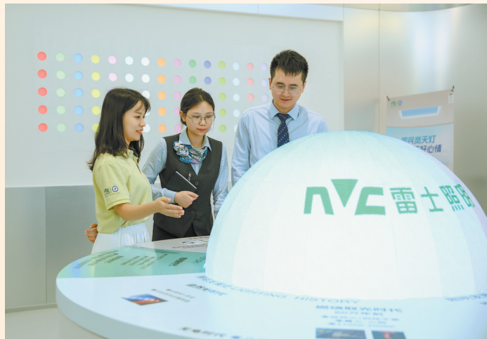
农行惠州分行员工在惠州雷士光电科技有限公司走访调研

“再造一个新广东”昂首阔步，高质量发展“粤”进奔腾！农行广东分行将继续当好服务实体经济的主力军，扎实做好普惠金融这篇大文章，为广东经济社会发展注入澎湃动力。