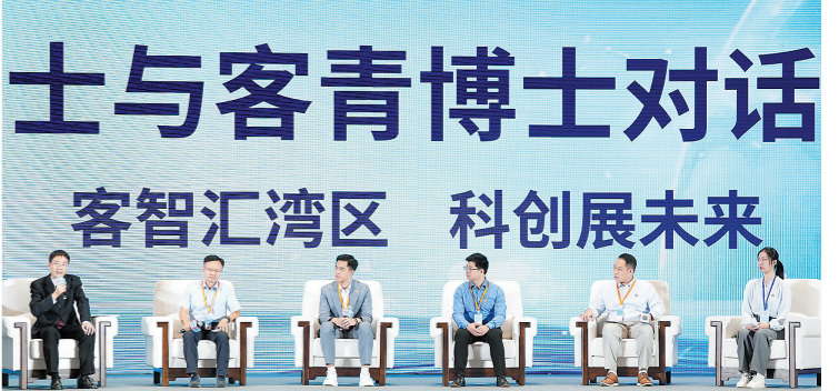
客属青年与客青博士对话活动现场

层次人才与国际同行之间的交流，从而提升科技创新的国际化水平。客属青年应加强合作，促进各地经贸与文化交流，实现共赢发展。