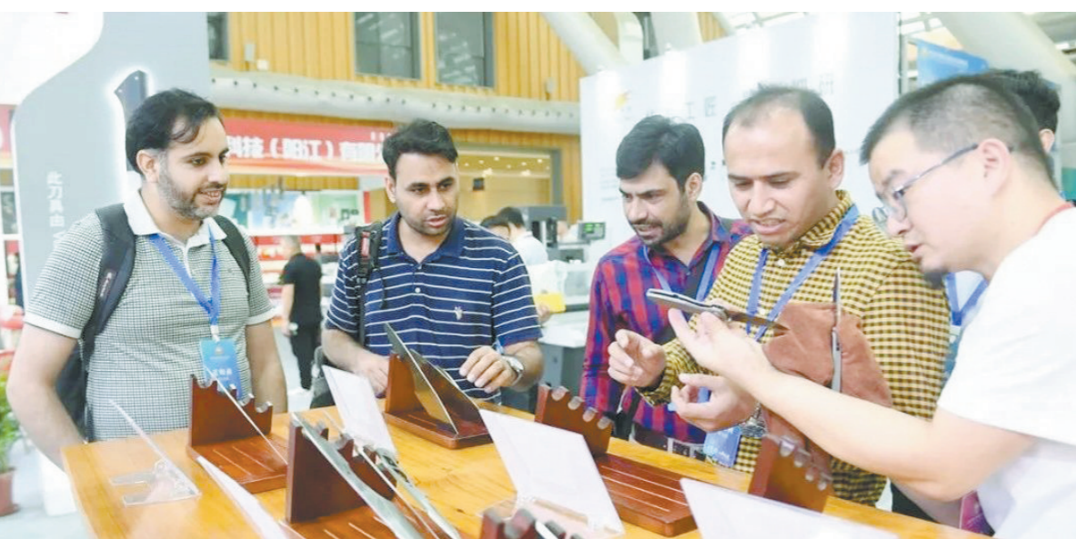
往年刀博会外商采购现场

目前，阳江继续聚焦新领域、新赛道，主动推动创新链、产业链、资金链、人才链深度融合，以科技创新引领形成新质生产力，不断提升在全球市场的竞争力，书写着“中国刀剪之都”的新篇章。