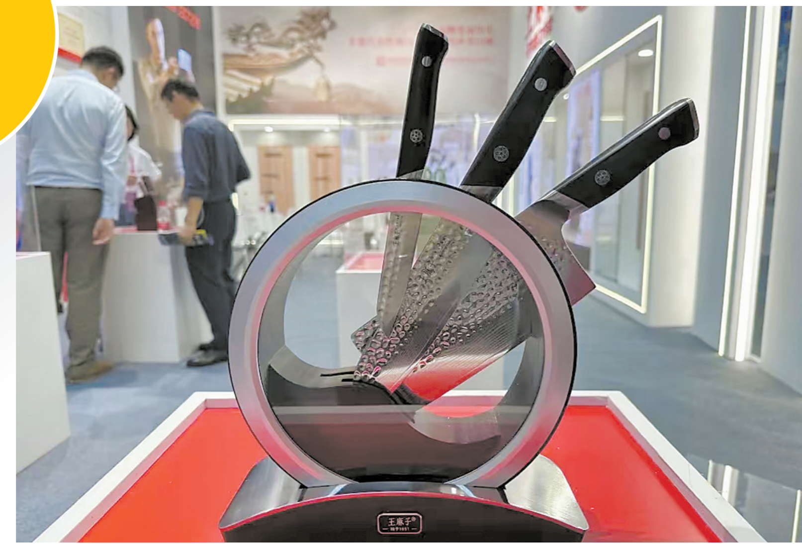
阳江刀剪焕发新活力

阳江刀剪产品不仅在国内外行业占比高，也是典型的外向型产业集群，有约三分之二的五金刀剪产品出口日本、欧盟等130多个国家和地区，在全国同行业中处于领先地位。 跨境电商作为当下新业态新模式的典型代表之一，成为实现内外贸融合的一个有效途径。2022年2月，国务院批准阳江设立中国（阳江）跨境电商综合试验区。借助这一政策创新高地，阳江市从企业培育、综合服务体系等方面给予全方位政策扶持，通过培训动员、对接资源、政策扶持等多维度发力，培育了一批本土跨境电商主体，跨境电商交易额也有所突破。 今年9月12日，2024年阳江部