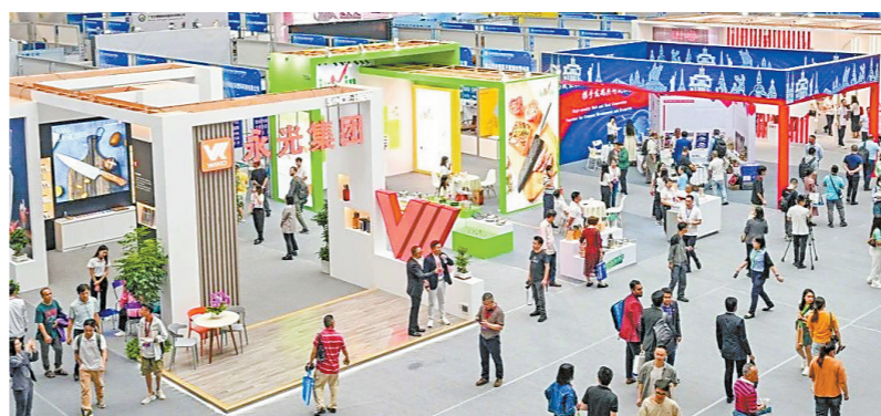
往年刀博会热闹场面