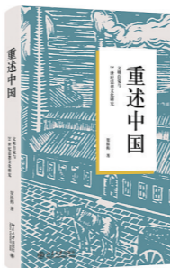
《重述中国:文明自觉与21世纪思想文化研究》 贺桂梅