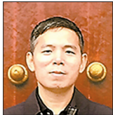
刘复生 海南省文艺评论家协会主席,海南大学人文学院教授