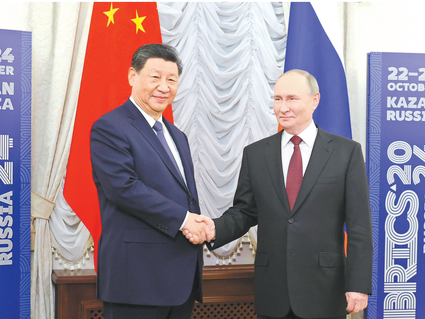
当地时间10月22日下午，国家主席习近平在喀山克里姆林宫同俄罗斯总统普京举行会晤。

新华社俄罗斯喀山10月22日电 当地时间10月22日下午，国家主席习近平在喀山克里姆林宫同俄罗斯总统普京举行会晤。习近平指出，今年是中俄建交75周年。75年来，中俄关系风雨兼程，探索出“不结盟、不对抗、不针对第三方”的相邻大国正确相处之道。双方秉持永久睦邻友好、全面战略协作、互利合作共赢精神，不断深化和拓展全面战略协作和各领域务实合作，为推动两国发展振兴和现代化建设注入强劲动力，为增进中俄人民福祉、维护国际公平正义作出重要贡献。当前，世界正处于百年未有之大变局，国际形势变乱交织，但中俄世代友好的深厚情谊不会变，济世为民的大国担当不会变。尽管面临复杂严峻的外部形势，两国贸易等各领域合作积极推进，大型合作项目稳定运营。双方要继续推动共建“一带一路”倡议和欧亚经济联盟深入对接，为促进各自经济高质量发展提供动力支撑。习近平强调，明年是联合国成立80周年，也是世界反法西斯战争胜利80周年，也是世界反法西斯战争胜利80周年，也是世界反法西斯战争胜利80周年。在双方共同努力下，目前两国各领域务实合作持续推进，俄中文化年各项活动顺利举办。俄方希望同中方进一步深化合作，助力两国发展振兴。明年是第二次世界大战结束80周年，俄中为世界反法西斯战争胜利作出了巨大牺牲，俄方愿同中方共同纪念这一重要时间节点。俄方愿同中方继续保持密切高层交往以及在国际事务中的战略沟通协作，共同维护国际公平正义和全球战略稳定。感谢中方在俄方担任金砖国家主席国期间提供有力支持，俄方愿同中方密切合作，确保金砖扩员后首次领导人会晤取得成功，推动“金砖合作”不断取得积极成果。两国元首还就共同关心的重大国际地区问题深入交换了意见。蔡奇、王毅等参加会晤。