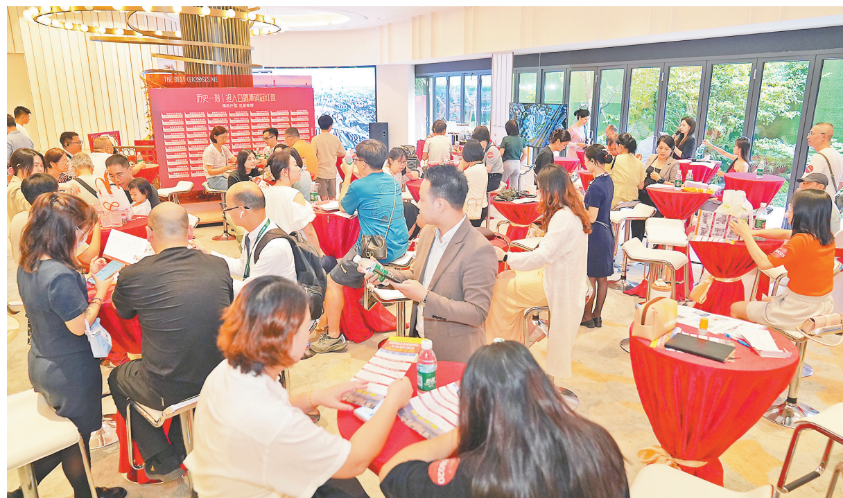
10月份以来广州楼市火热，荔湾区新世界天麓楼盘营销中心国庆假期挤满购房者

期网签两套750平方米的单位，总价均超2亿元；同在天河区的侨鑫汇悦台，更是网签了一套建筑面积超1000平方米的顶层复式单位，总价约4.61亿元，每平方米价格达37万元，远超深圳天琴湾单套总价3.8亿元的纪录；海珠区的中海大境数次推售热销后，目前已累计成交破百亿元。 除了高端市场外，广州的改善及刚需型楼盘行情同样火热。从广州市房地产行业协会大致统计情况来看，中海江泰里、中海亚运城、中海浣花里、星瀚TOD、富颐都荟、中旅天宸府等项目，国庆至今销售额都超过1亿元。