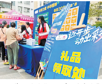
茂名体彩“迈开步 动出彩”主题活动吸引大量市民参与

性,积极响应“体育赛事进景区、进街区、进商圈”号召,鼓励市民群众加入全民健身的活动中,参与体育锻炼,追求健康生活。