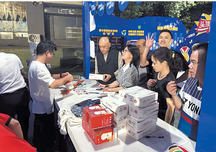
韶关体彩宣传展示区

近日,记者从广东体彩获悉,为答谢广大购彩者对中国体育彩票一直以来的大力支持,韶关体彩于10月19日至12月25日期间,推出总额高达150万元的赠票活动。