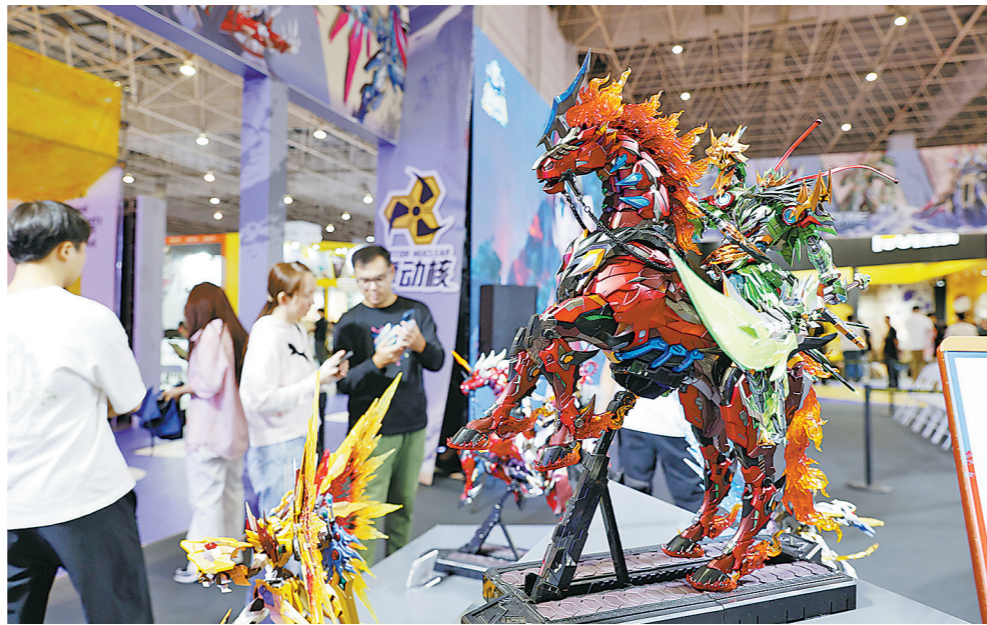
“中国潮玩之都·东莞”潮玩专区展出的摩动核潮玩