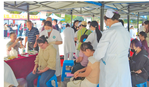
活动现场

本次活动由广东省中医药局指导，羊城晚报报业集团、广东省中医院主办，羊城晚报教育健康部、羊城晚报大健康研究院、鹤山市中医院承办，鹤山市卫生健康局协办。