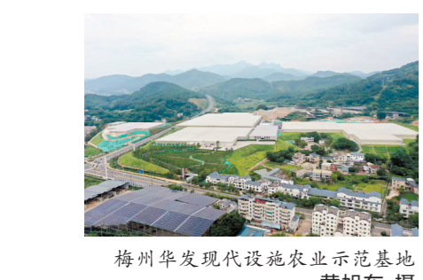
梅州华发现代设施农业示范基地

文/危健峰 陈世明 萧潇 陈震寰 “百千万工程”实施以来,梅州梅县区抢抓机遇,全面激励干部群众投身“百千万工程”,凝聚全社会合力,以百千万群众干“百千万工程”,以“头号力度”攻坚“头号工程”,举全区之力建好全省“百千万工程”典型区。