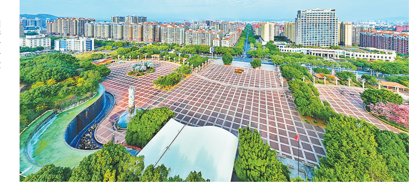
梅县新城

漫步梅南镇新塘村,沿河两岸种植的各色花木迎风而立。“这些树木都是我们新塘村乡贤出资捐种的,有人面子、海南红豆、宫粉紫荆等,总价值约35万元。”在河面上供人休闲游玩的凉亭里,新塘村党总支书记黎洪亮指着两岸茁壮成长的树苗,如数家珍。