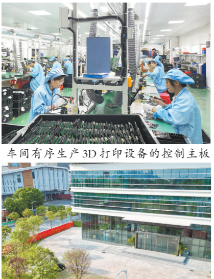
车间有序生产3D打印设备的控制主板

谋划新发展，改革勇先行。荔湾区深入学习贯彻党的二十届三中全会精神，将“健全因地制宜发展新质生产力体制机制”列入改革任务清单。以现代都市工业立区，基于激光与增材制造产业资源，前瞻布局产业平台，强化产业发展要素、建造优质载体空间，为聚“荔”现代都市工业发展筑好“巢”、引好“凤”。