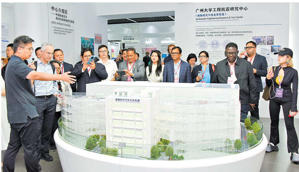
世界大学校长广州行首站到访番禺

辉煌成绩的背后，是番禺区“五外联动”战略的深远布局，更是其全力以赴、高水平“筑巢引凤”的坚定决心。迎接全球投资者的到来，番禺以更加开放的姿态、更加创新的思维、更加务实的行动，在全球化的舞台上绽放出更耀眼的光芒。