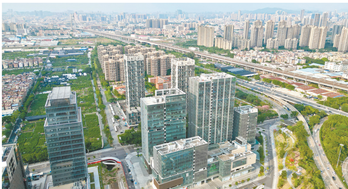
海龙围科创区优质载体相继落成