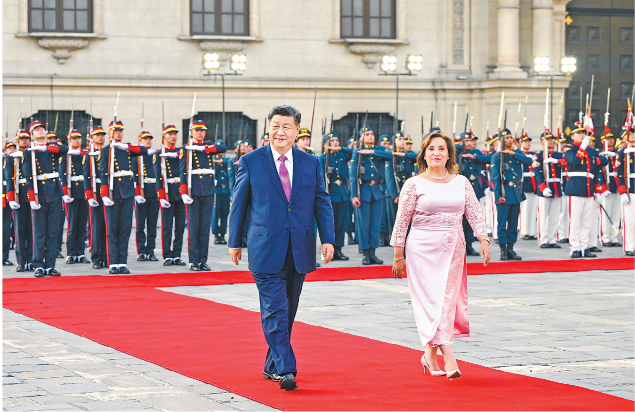
当地时间11月14日下午，国家主席习近平在利马总统府同秘鲁总统博鲁阿尔特举行会谈。博鲁阿尔特在总统府前广场为习近平举行隆重盛大欢迎仪式。

新华社利马11月14日电 当地时间11月14日下午，国家主席习近平在利马总统府同秘鲁总统博鲁阿尔特举行会谈。