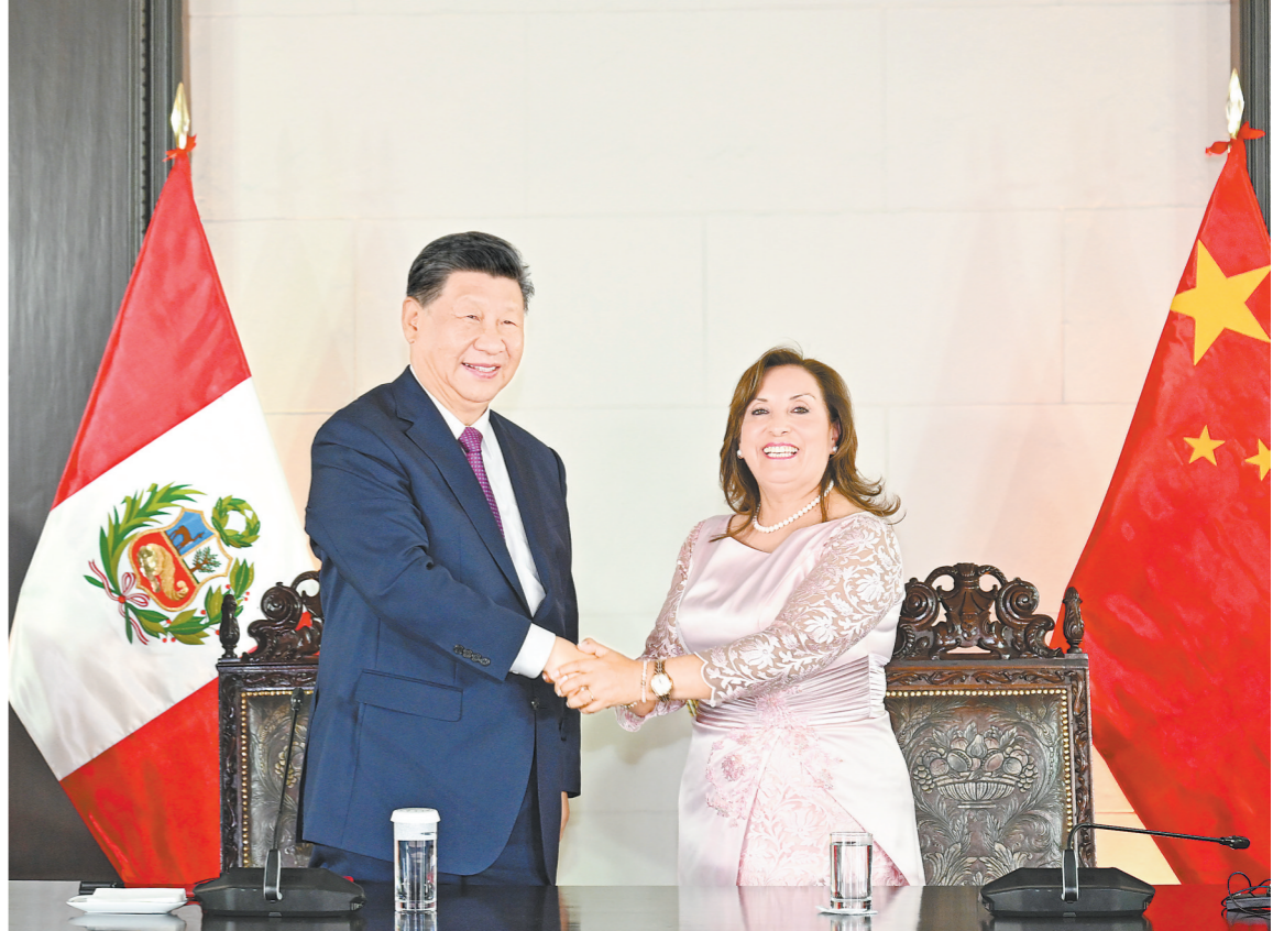
当地时间11月14日晚，国家主席习近平同秘鲁总统博鲁阿尔特在利马总统府以视频方式共同出席钱凯港开港仪式。