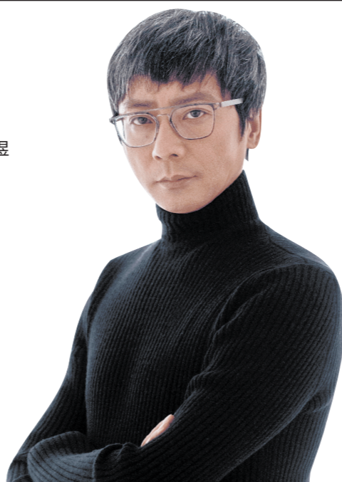
著名舞美灯光设计师任冬生