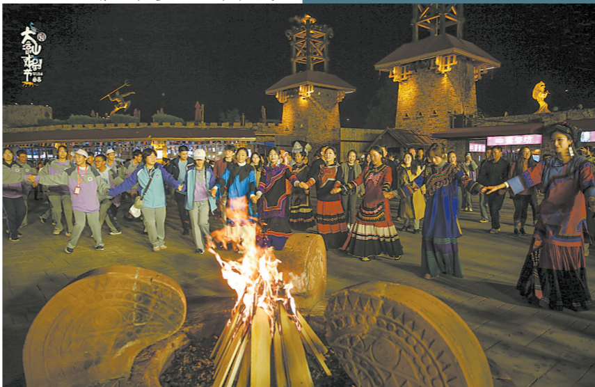
彝族文化滋养着大凉山戏剧节