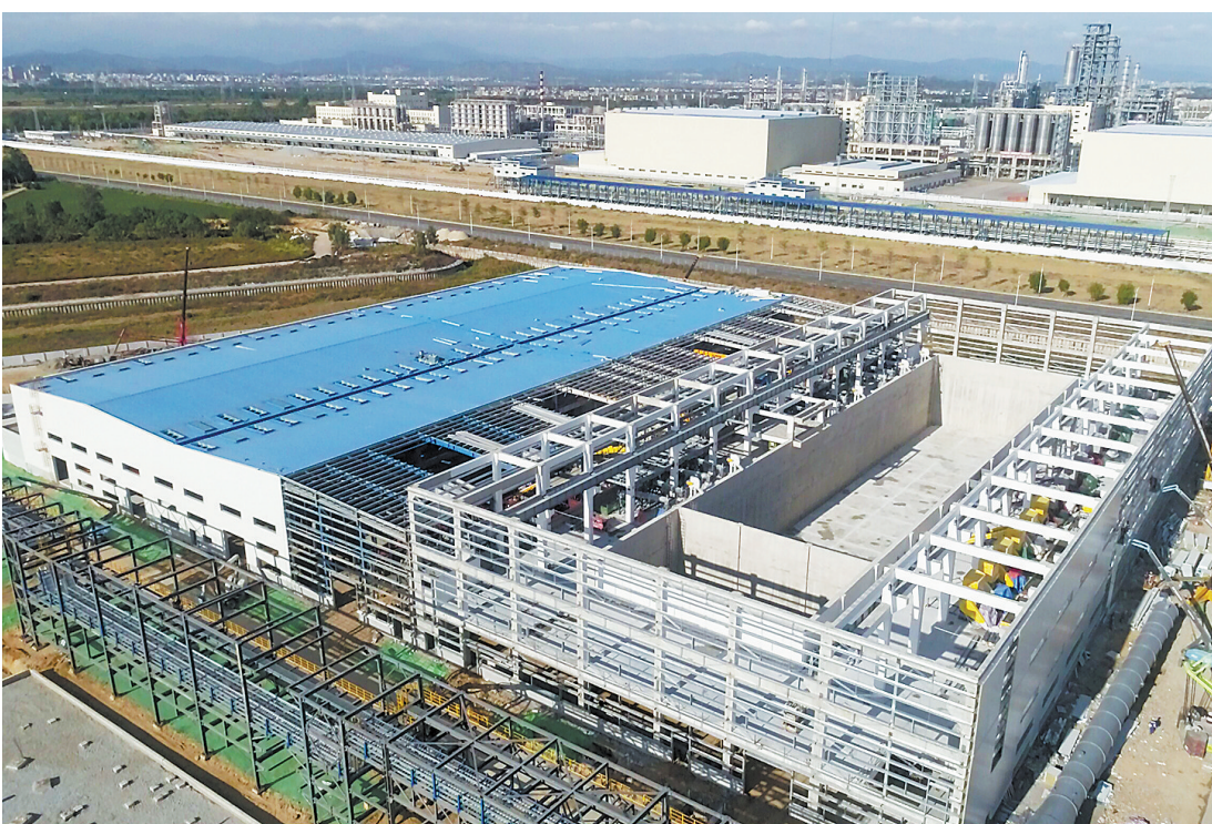
作为建行为广东省落地的首批符合政策要求的技术改造贷款项目，东粤化学废弃资源回收利用项目设备技术得以进一步焕新升级

“我们已经入选国家第一批技术改造再贷款项目名单，真是赶上好时代了，撸起袖子加油干吧！”该财务负责人补充提到。当前，为配合珠海迈为加快扩片机、固晶机、焊线机等核心设备到位投入生产，建行珠海市分行已为其投放4800万元贷款。