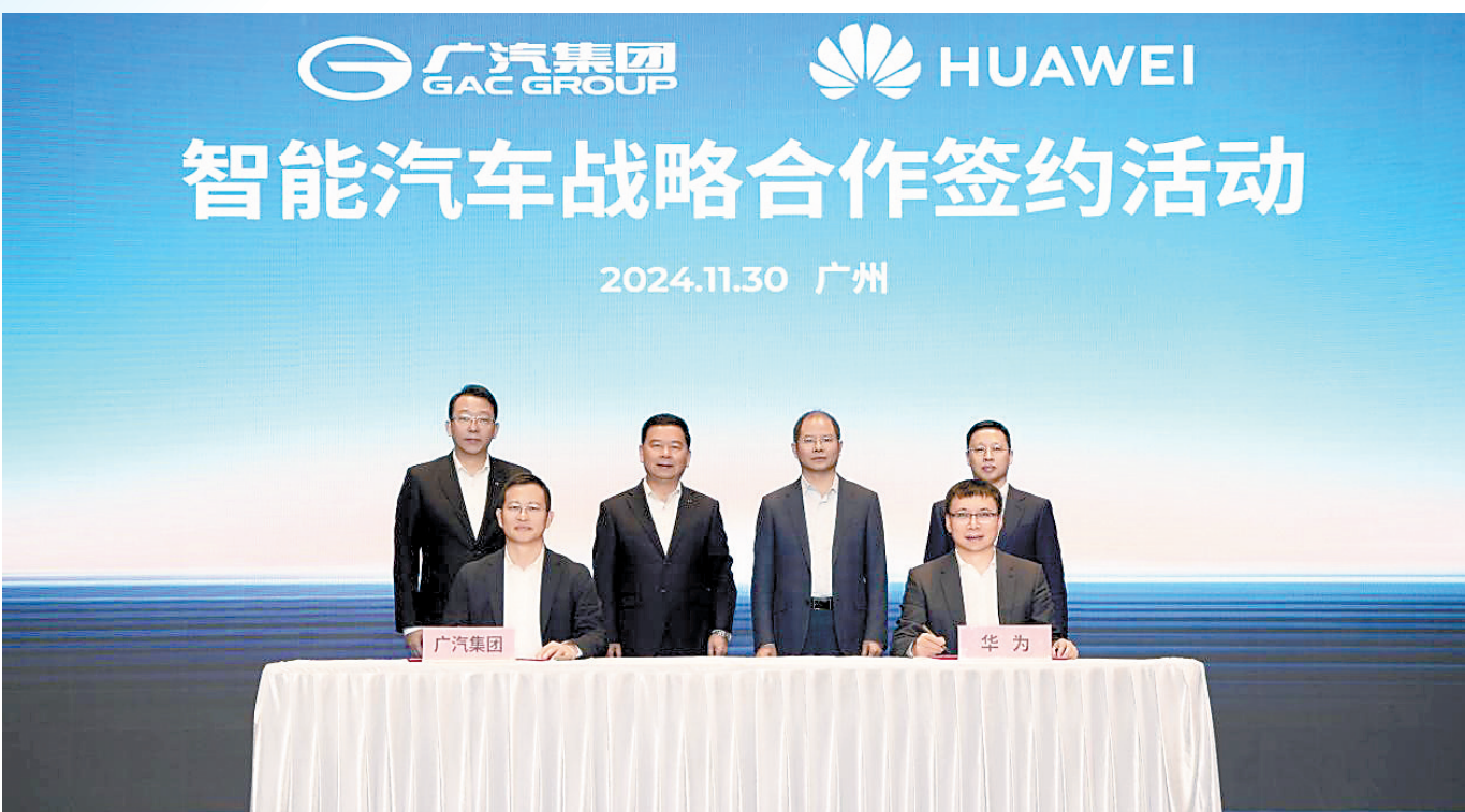
广汽集团与华为智能汽车战略合作签约仪式

11月26日下午，华为和江淮汽车合作的高端豪华品牌“尊界”S800首度亮相。随后48小时内收获订单2108辆。按单辆2万元的意向金计算，已入账4216万元。48小时4216万元，这是一个让多少车企双眼发光的数字。要知道，传统车企再怎么埋头造车、老总直播，再大谈研发投入、以质求存，都要找到一个市场红利的支点，华为鸿蒙智行也许就是这个历史支点。